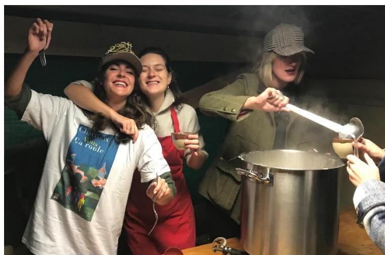
4 Novembre Fête de la Soupe