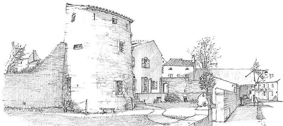
Dessin de Vincent Brunot

Nous remercions les bénévoles et toutes les personnes qui ouvrent leurs jardins ou cours lors de la fête du mois d'août.