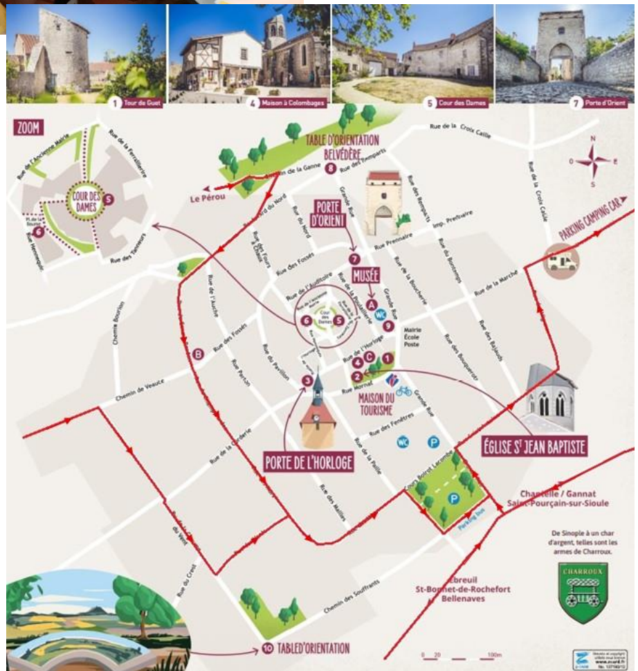
Plan de circulation : suivre le fléchage rouge

De Sinopie à un char d'argent, telles sont les armes de Charroux.