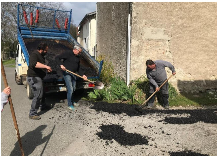
Entretien de la voirie communale

Changement du réseau d'assainissement Rue de la Poulaiillerie