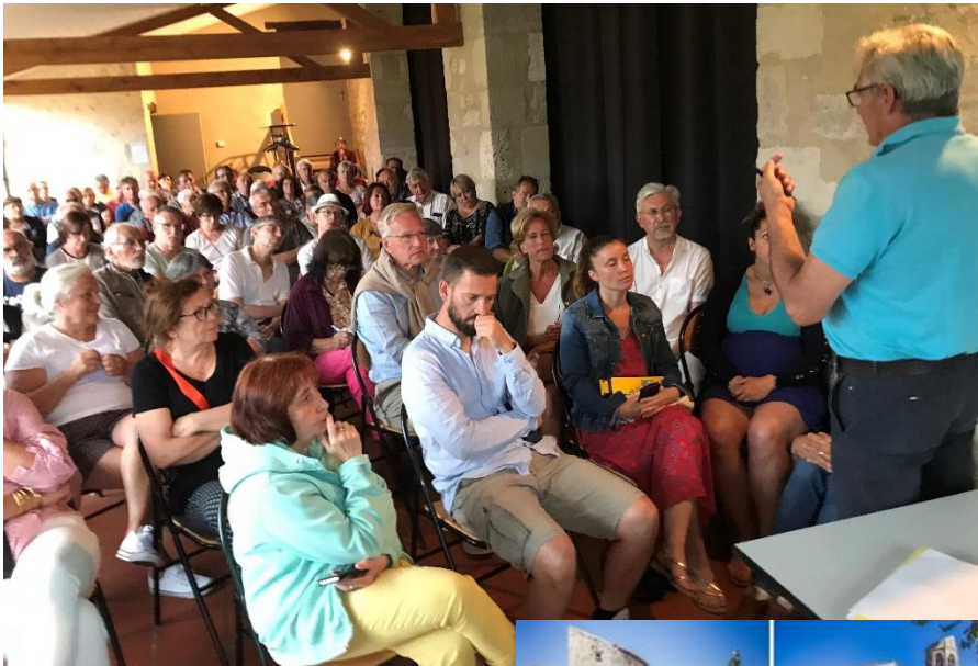
Un vif intérêt des habitants durant la présentation des parkings payants et du plan de circulation

A la fin de la saison, l'équipe municipale fera un bilan afin de se rendre compte si des modifications doivent être apportées sur le plan de circulation du village et la signalétique en place.