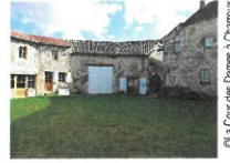
© La Cour des Dames à Charroux