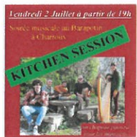
©Soirée Irlandaise au Barapotin