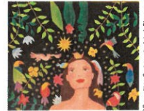
©Exposition Graines de Joie à Charroux