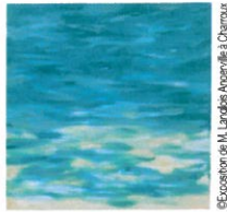
© Exposition de M. Langlois Angerville à Charroux