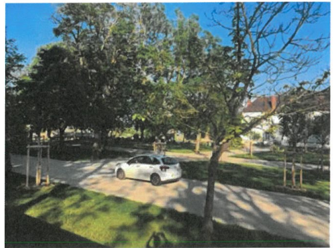
Lot n°1: Voiries, parkings, végétalisation