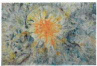
© Exposition Mme MOISY à Charroux