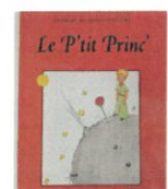
©Le 'petit Prince' en patois Bourbonnais

Maison du Tourisme 20 rue Grande 03140 CHARROUX Tél. 04 70 56 87 71