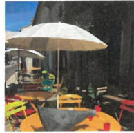
© La Terrasse du Barapotin à Charroux